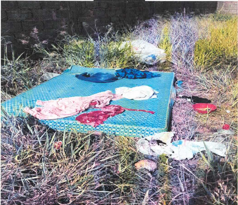
Foto 02- No entorno da APAC